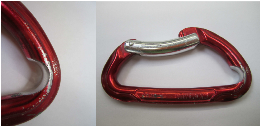
Figura 1: Moschettone con formazione di spigoli taglienti dovuti all'attrito della corda.

I test condotti presso l'impianto di prova di caduta a norma di Mammut sul moschettone illustrato nella Figura 1 hanno dimostrato che una corda da 9,5 mm con una massa in caduta di 80 kg viene tranciata già a un'altezza di caduta di 2,7 m / fattore di caduta 1.0. Il moschettone utilizzato non presentava spigoli estremamente taglienti. Verifiche precedenti hanno inoltre dimostrato che nella pratica, a causa dell'attrito all'interno della catena di assicurazione, il fattore di caduta può essere notevolmente superiore rispetto al valore calcolato. Se a questo si aggiungono moschettoni con spigoli molto taglienti, anche piccolissime cadute da altezze inferiori a un metro possono rivelarsi critiche. Sono noti casi di rottura della corda senza gravi conseguenze grazie alla caduta da altezze non elevate.